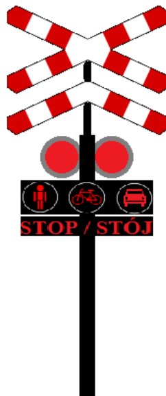
Sygnalizator nr 3