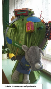
Szkoła Podstawowa w Żyrardowie