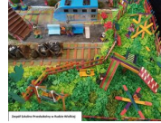
Zespół Szkolno- Przedszkoln y w Rudzie Wielkiej