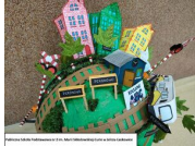
Publiczna Szkoła Podstawowa nr 2 im. Marii Skłodowskie j-Curie w Jelczu- Laskowice