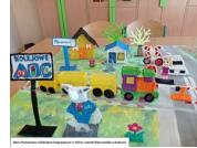
Szkoła Podstawowa z Oddziałami Integracyjni mi nr 105 im. Ludwiki Wawrzynski ej w Krakowie